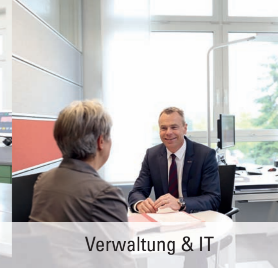
Verwaltung & IT