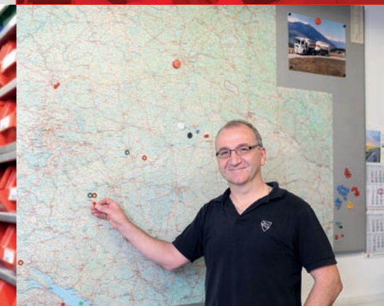
Logistik und Disposition