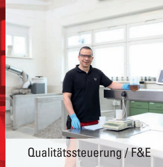
Qualitätssteuerung / F&E

Um SCHWENK weiterzuentwickeln, packen alle mit an: vom Allrounder im Werk bis zum Fachspezialisten in der Verwaltung. Die SCHWENK-Welt ist vielfältig und bietet verschiedenste Möglichkeiten in den unterschiedlichsten Bereichen.