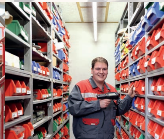
Material- und Lagerwirtschaft